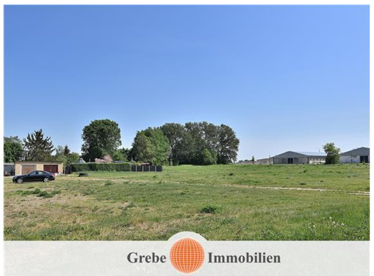
4.300,00 qm Grundstück