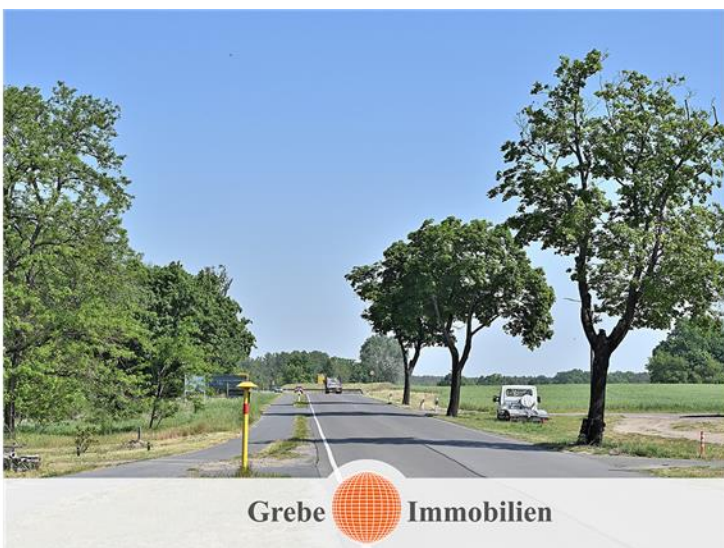
Direkte Anbindung B 101