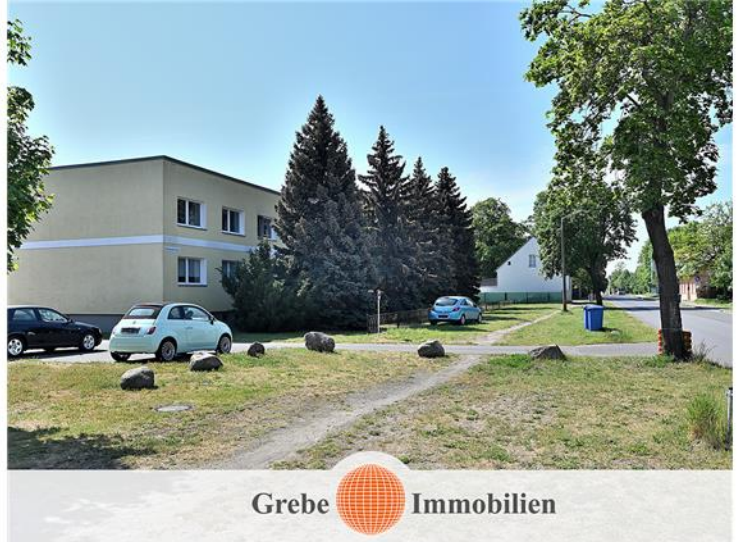
und vor dem Haus